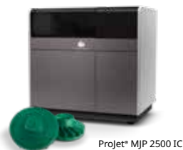
Projet® MJP 2500 IC

3D Systems ofrece productividad de impresión y nuevas eficiencias de fabricación con una producción de patrones de fundición impresos en 3D sin herramientas