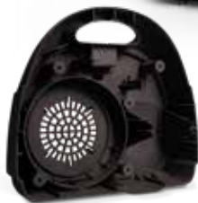
DuraForm EX Black でプリントされた掃除機の背面カバー