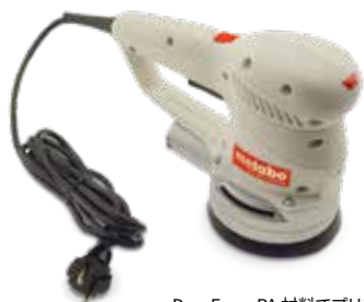
DuraForm PA 材料でプリントされた研磨機ツールハウジング

3D Systems sPro SLS システムは共通の構造を共有し、中程度から大規模造型容積で利用可能な、高解像度の、耐久性のある熱可塑性パーツをもたらします。