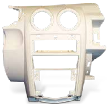
DuraForm PA ダッシュボード