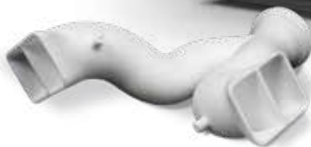
DuraForm ProX FR1200 でプリントされたマニフォールド