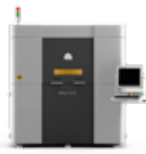
sPro 60 HD-HS