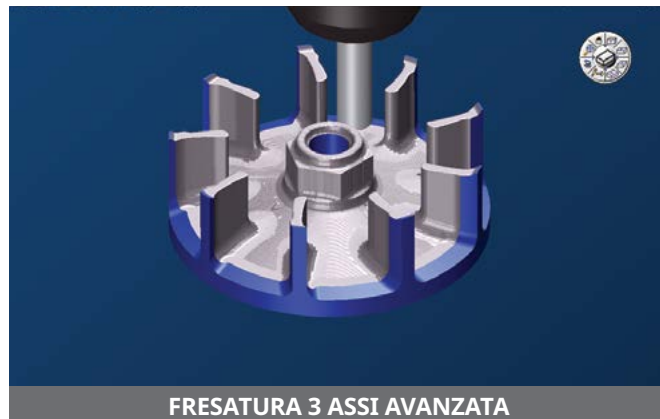
FRESATURA 3 ASSI AVANZATA